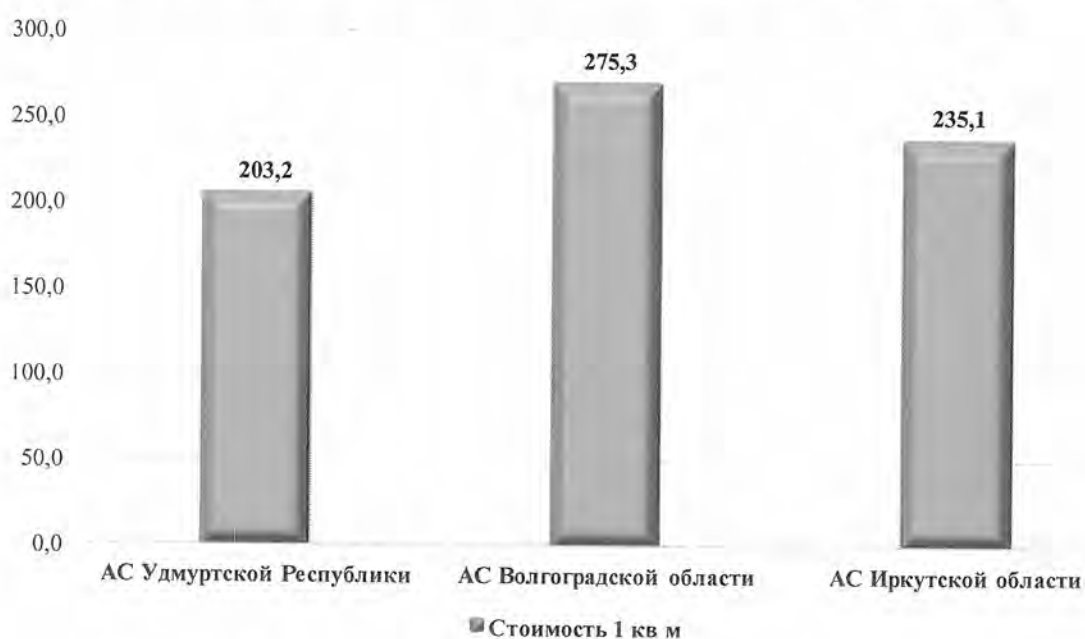
Рисунок 3. Стоимость 1 кв. м зданий Арбитражных судов, тыс. руб.

Стоимость строительства 1 кв. м зданий арбитражных судов находилась в диапазоне от 203,2 тыс. до 275,3 тыс. рублей за 1 кв. м (расчетно).