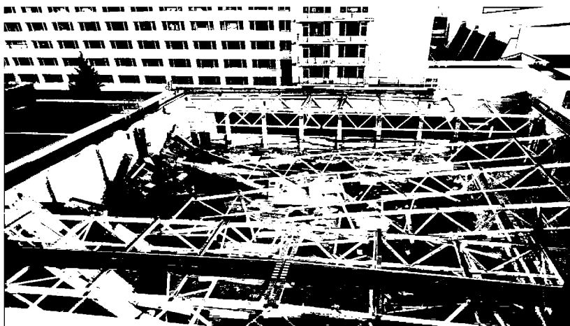
Рисунок 2. Разрушение кровли бассейна СОК № 3