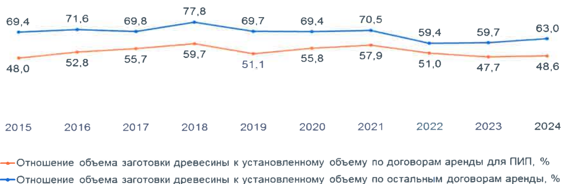
Рисунок 6. Сведения об освоении ежегодной расчетной лесосеки

В целом в Российской Федерации освоение полученного в льготном порядке для реализации ПИП лесного ресурса ниже, чем по договорам аренды, заключенным для заготовки древесины в общем порядке.