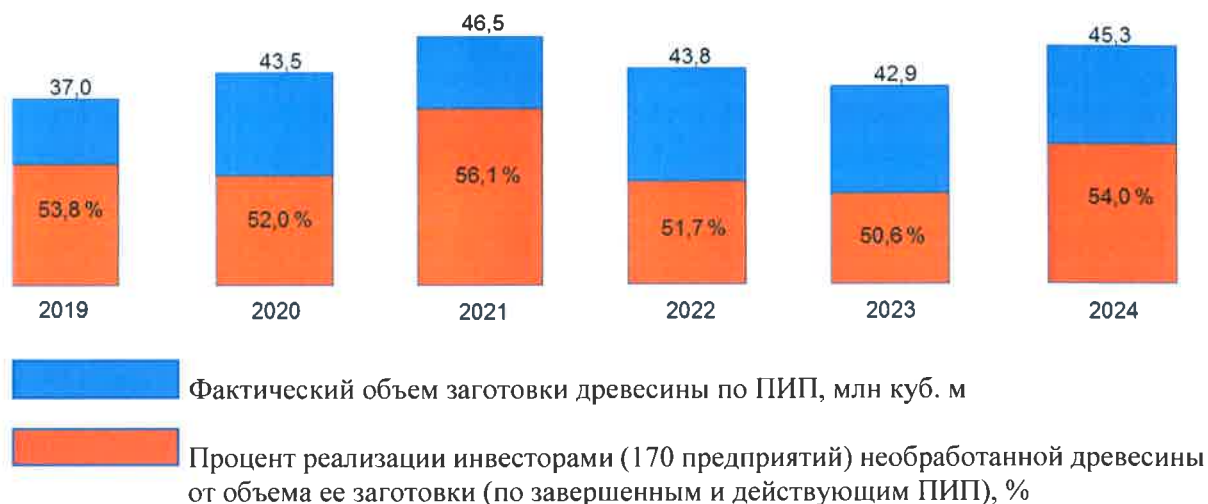
Рисунок 4. Сведения о доле реализации инвесторами необработанной древесины в объеме ее заготовки по завершенным и действующим ПИП

• Критерий «Созданные объекты лесной и лесоперерабатывающей инфраструктуры и (или) модернизированные объекты лесоперерабатывающей инфраструктуры функционируют» (К2) выполнен частично, поскольку не все созданные и (или) модернизированные в рамках завершенных ПИП объекты лесоперерабатывающей (лесной) инфраструктуры функционируют.