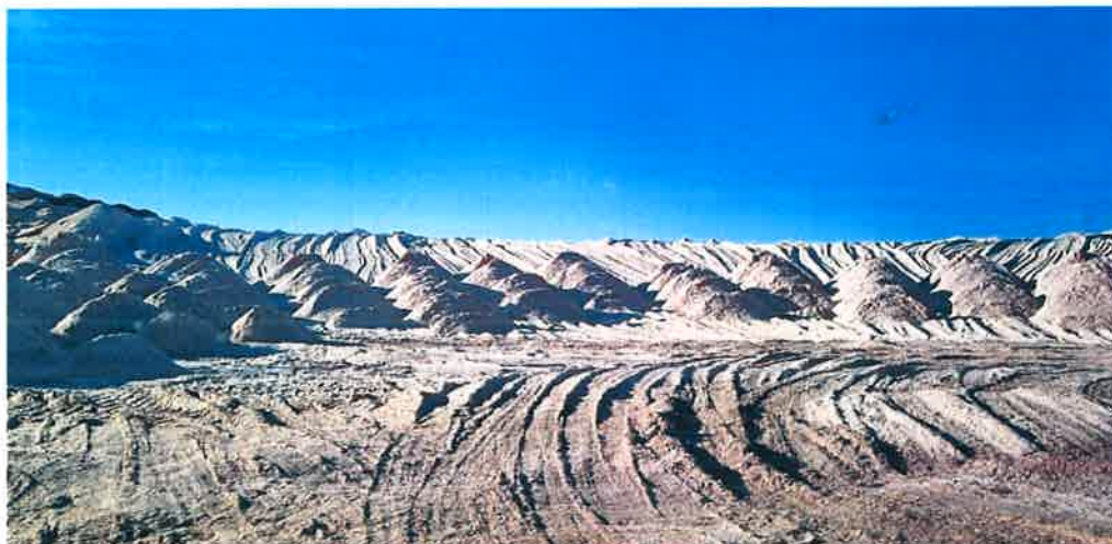
Рисунок 5. Размещение отходов от переработки древесины при реализации ПИП ООО «Группа компаний «УЛК»

Как следствие, продолжает оставаться актуальной проблема накопления отходов лесопереработки. Отсутствие действенных механизмов по их утилизации влечет масштабное увеличение отходов производства и, следовательно, серьезные экологические последствия (неутилизированные отходы влекут риск возникновения пожаров и являются источником выбросов углекислого газа).