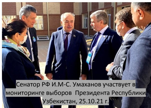
Сенатор РФ И.М-С. Умаханов участвует в мониторинге выборов Президента Республики Узбекистан, 25.10.21 г.

18 ноября 2021 года сенатор принял участие во встрече глав верхних палат парламентов России и Египта.