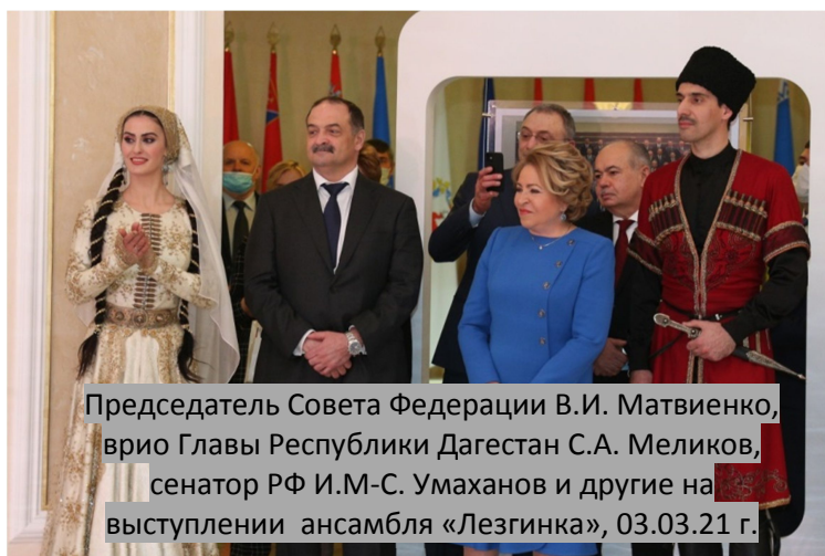
Председатель Совета Федерации В.И. Матвиенко, врио Главы Республики Дагестан С.А. Меликов, сенатор РФ И.М.-С. Умаханов и другие на выступлении ансамбля «Лезгинка», 03.03.21 г.

С концертной программой в здании Совета Федерации выступил Государственный академический заслуженный ансамбль танца Дагестана «Лезгинка».