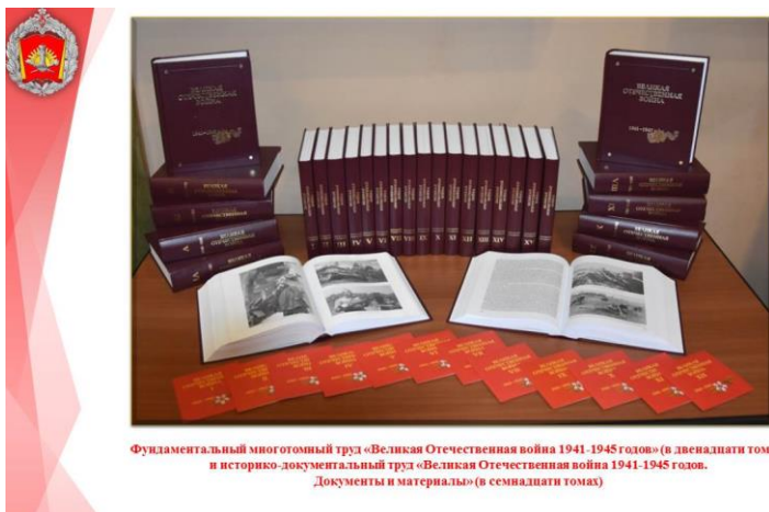
Фундаментальный многотомный труд «Великая Отечественная война 1941-1945 годов» (в двенадцати томах) и историко-документальный труд «Великая Отечественная война 1941-1945 годов. Документы и материалы» (в семнадцати томах)

5 ноября 2019 года Военный университет отмечает 100 – летие со дня своего образования. Все эти годы командование и профессорско-преподавательский состав военно-учебного заведения уделяло и продолжает уделять особое внимание военно-патриотическому воспитанию курсантов и слушателей. Формирование личностных качеств патриота своей Родины - одно из важнейших направлений в военно-профессиональной подготовке защитника Отечества. Основу военно-патриотического воспитания составляют идейно - политическое и морально - психологическое воспитание наряду с современной военно-профессиональной подготовкой выпускников. Сегодня мы обращаемся к опыту военно-патриотического воспитания в нашей стране, полученному в предвоенные годы и годы мировых войн XX столетия. Военный университет выступил