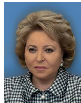
Валентина Ивановна МАТВИЕНКО, Председатель Совета Федерации Федерального Собрания Российской Федерации

ка государства должна решать именно эту задачу. Продолжим продвигать такой подход в рамках предстоящей осенью работы над бюджетом.