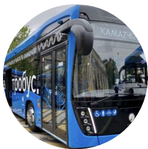
ЗАКУПКА ЭЛЕКТРОБУСОВ г. Москва

ПРОЕКТЫ, НА КОТОРЫЕ ПРИВЛЕКАЛИСЬ СРЕДСТВА ДЛЯ СОФИНАНСИРОВАНИЯ: