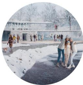
ГОРОДСКАЯ ДОЛИНА г. Черняховск