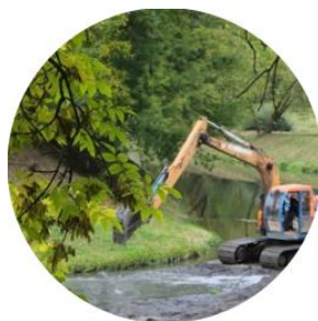
РАСЧИСТКА РУЧЬЯ ГАГАРИНСКИЙ г. Калининград