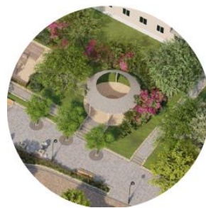
РЕКУЛЬТИВАЦИЯ СВАЛОК г. Советск, г. Черняховск