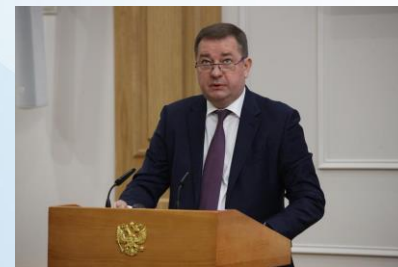
Дни Новгородской области