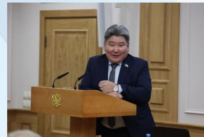
Дни Республики Саха (Якутия)