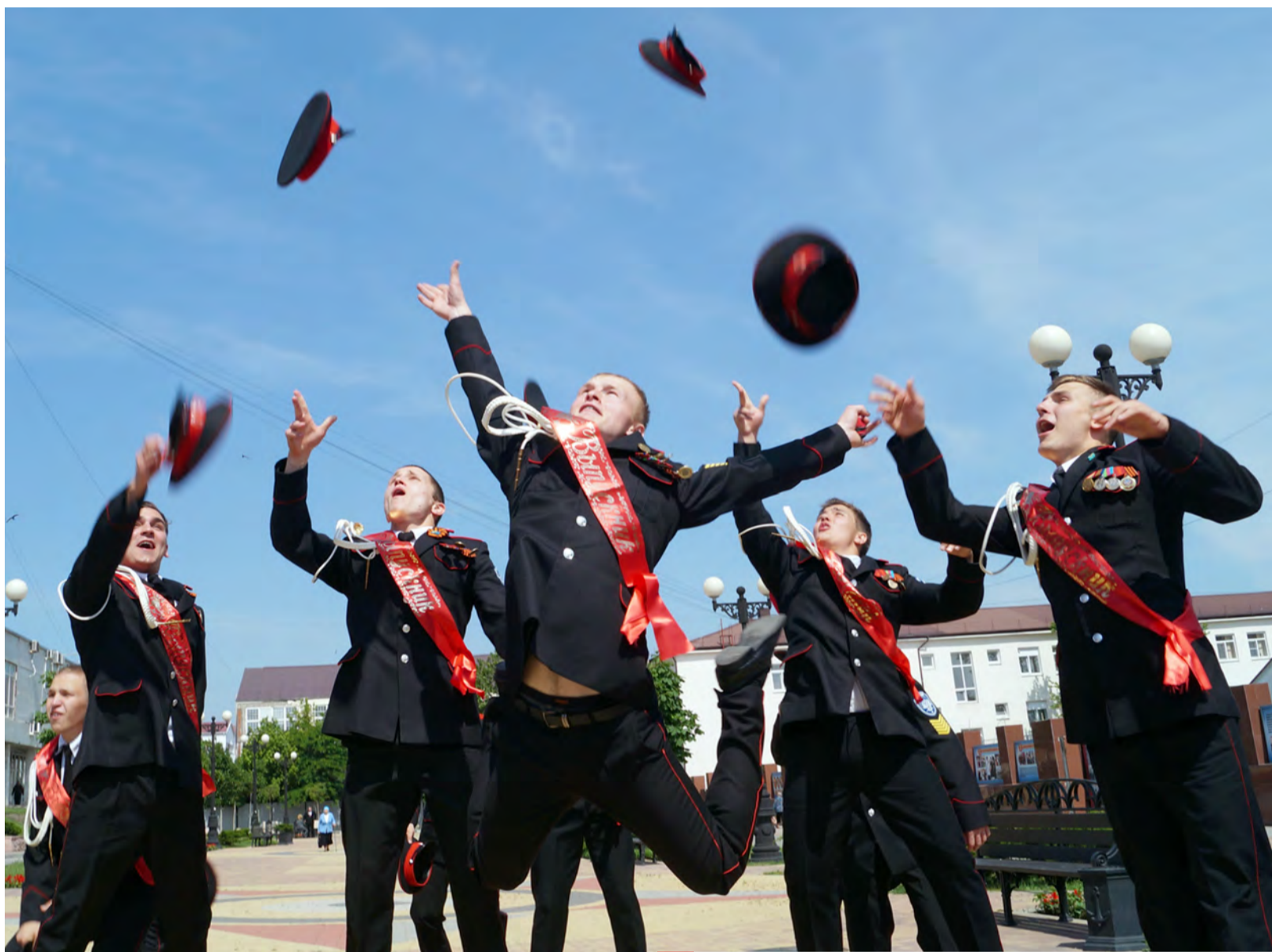
Хочется крикнуть: «Ура! Свобода!», но впереди еще экзамены.

Последний день учебного года Новороссийский казачий кадетский корпус встретил в тройке финалистов Всероссийского смотра-конкурса