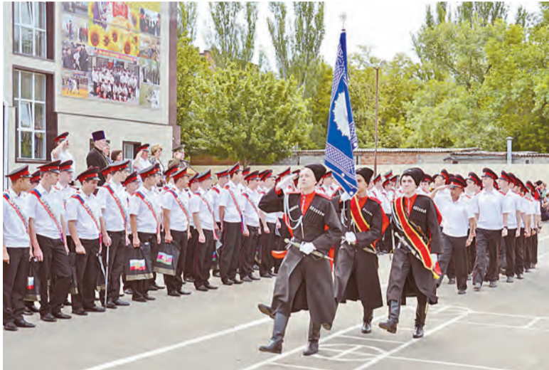
Последний раз прошагали маршем по родному плацу.

Четыре года для воспитанников 11-й сотни пролетели очень быстро