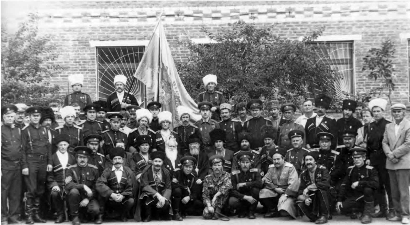
Участники совета атаманов казачьих обществ Майкопского отдела.

Иногда одна старая фотография может рассказать больше, чем архивный документ