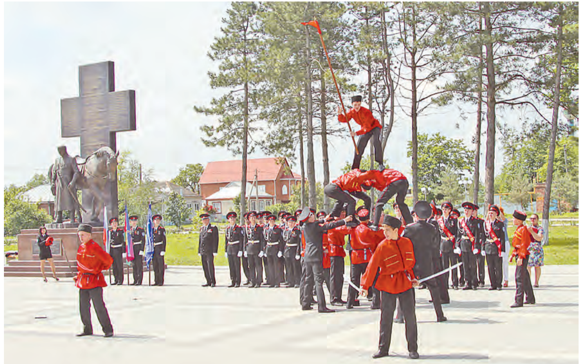
Молодые казаки учатся в корпусах, в том числе и джигитовке.