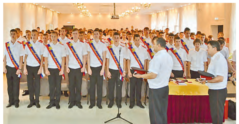
Никогда не забудем родной корпус.

пожелали своим кадетам всего самого лучшего. Очень трогательными были слова родителей в адрес всех сотрудников корпуса и выпускников. Особую признательность родители выразили атаману