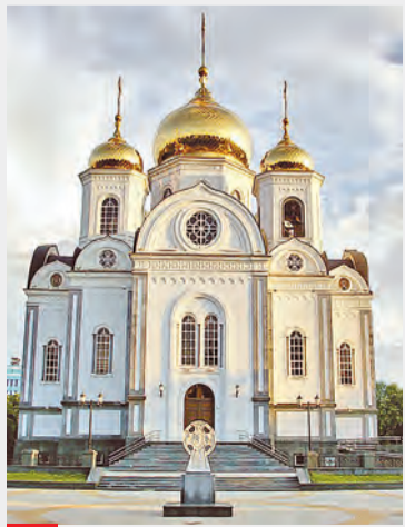
Собор Александра Невского — точная копия старого храма.

Храм простоял всего 60 лет. 28 октября 1929 года собор был