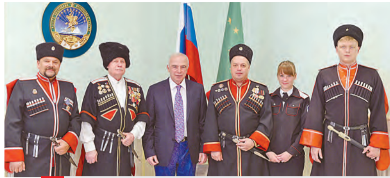
Глава Адыгеи Аслан Тхакушинов и делегация казаков МКО.