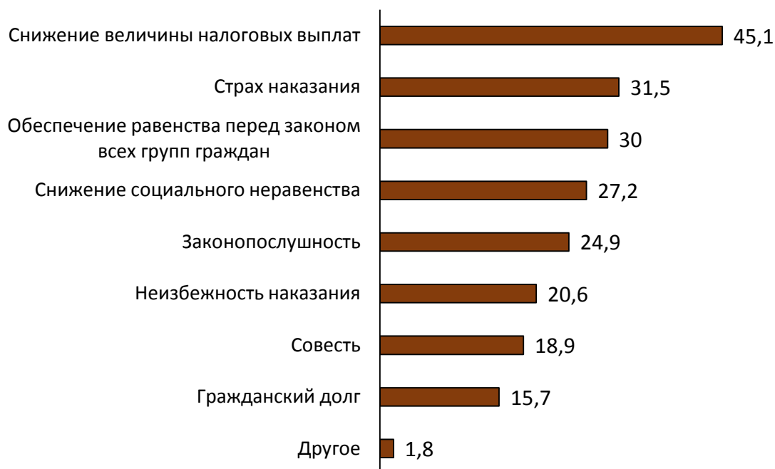
Рисунок 3 - Обстоятельства, влияющие на стремление граждан выполнять свои обязанности по оплате необходимых налогов ( в % от общего количества опрошенных )

В ходе проведения интервью респондентов спросили, что же, по их мнению, может повлиять на стремление граждан выполнять свои обязанности по оплате необходимых налогов. Распределение ответов на данный вопрос представлено на рисунке 3.