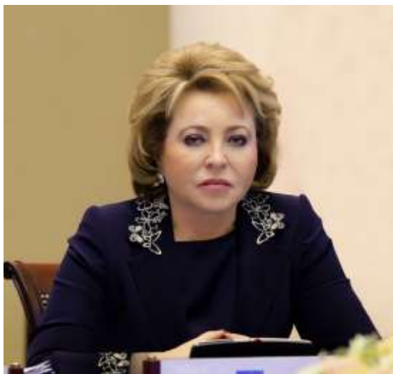
Председатель Совета Федерации Федерального Собрания Российской Федерации Валентина Ивановна МАТВИЕНКО