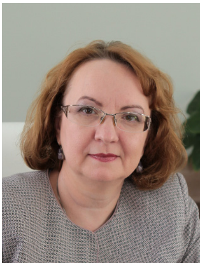
И.В. Никишина, министр труда, занятости и миграционной политики Самарской области