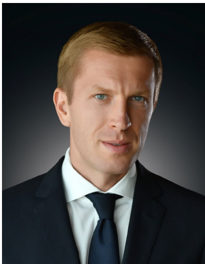
А.А. Ученов, заместитель Министра промышленности и торговли Российской Федерации