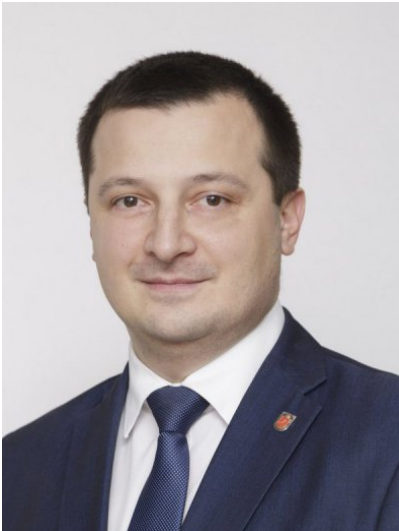
А.В. Филиппов, министр труда и социальной защиты Тульской области