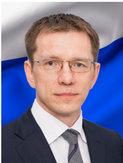
А.А. Охлопков, первый заместитель Губернатора Ханты-Мансийского автономного округа – Югры