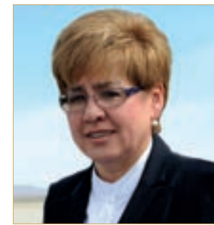
Наталья Николаевна ЖДАНОВА, губернатор Забайкальского края

Сегодня Забайкальский край продолжает развиваться, используя свои богатые минерально-сырьевые, земельные, лесные и водные ресурсы, отлаженную транспортную схему и выгодное географическое положение. Он является надёжным связующим звеном между центральными районами России не только с Дальним Востоком, но и с соседним Китаем и другими азиатскими странами. А главный ресурс региона – это люди, наши земляки, показавшие яркий пример многовековой практики мирного и созидательного сосущество-