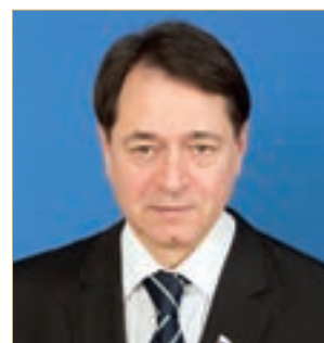
Сергей Владимирович ШАТИРОВ, заместитель председателя Комитета Совета Федерации по экономической политике, представитель от законодательного (представительного) органа власти Кемеровской области, горный инженер

– Владимира Ивановича Вернадского справедливо называют «Ломоносовым XX века». Что значит для вас его личность?