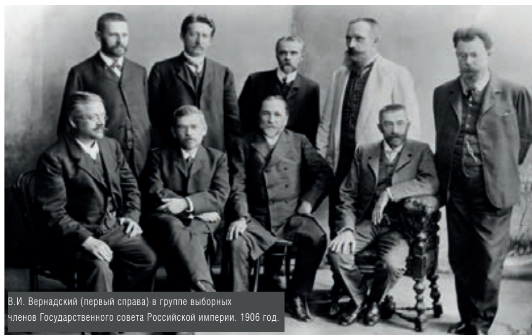
В.И. Вернадский (первый справа) в группе выборных членов Государственного совета Российской империи. 1906 год.