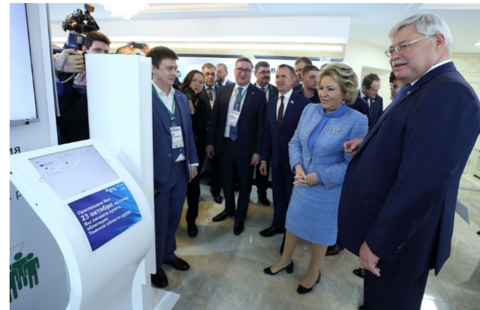
Фото. Демонстрация возможностей Платформы Маркетплейс АО ВТБ Регистратор на дне Томской области в Совете Федерации в 2019 году.

На текущий момент, помимо 2-х выпусков облигаций Томской области - на Платформе размещаются облигации 4-х выпусков 3-х коммерческих компаний.