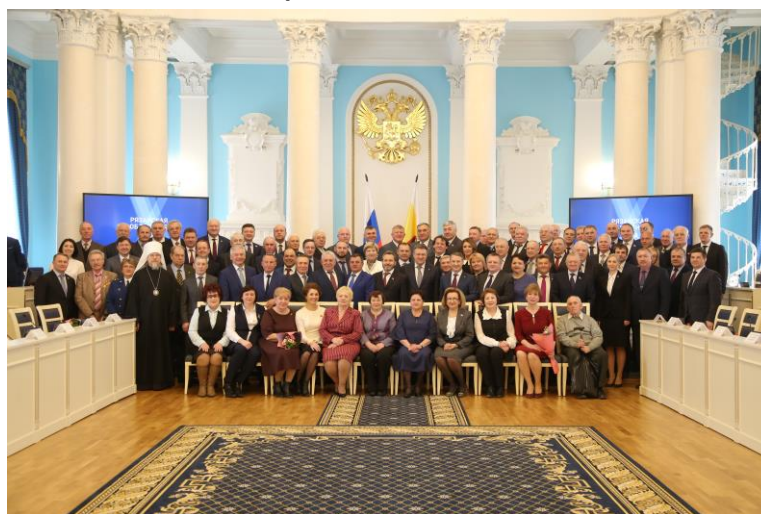
Депутаты I–VI созывов и гости мероприятия, посвященного 25-летию Рязанской областной Думы

Первые выборы в Рязанскую областную Думу состоялись 27 марта 1994 года. С этого времени она избиралась 6 раз, ответственного звания «депутат Рязанской областной Думы» удостоены 123 человека, 53 из них работали в двух и более созывах, 7 — избирались на 4 и более срока.