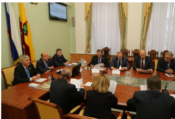
Слева. Обсуждение проекта Муниципальные инициативы с общественностью. Лесновское городское поселение. Справа. Обсуждение совершенствования нормативного правового регулирования подготовки кадров и состояния рынка труда в Рязанской области

В настоящее время перед депутатским корпусом стоят новые задачи по законодательному обеспечению на региональном уровне всех стратегических направлений, обозначенных в Майских Указах Президента Российской Федерации, выполнению социальных программ и принятых перед гражданами обязательств, улучшению качества жизни граждан. С 2019 года Рязанская область участвует в 11 национальных проектах, на которые выделяются значительные федеральные средства. Депутаты Рязанской областной Думы осуществляют парламентский контроль за их реализацией.