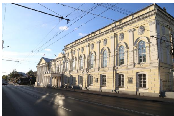
Здание Рязанской областной Думы

Первые выборы в Рязанскую областную Думу состоялись 27 марта 1994 года. С этого времени она избиралась 6 раз, ответственного звания «депутат Рязанской областной Думы» удостоены 123 человека, 53 из них работали в двух и более созывах, 7 — избирались на 4 и более срока.