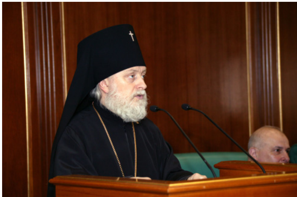
Архиепископ Верейский Евгений