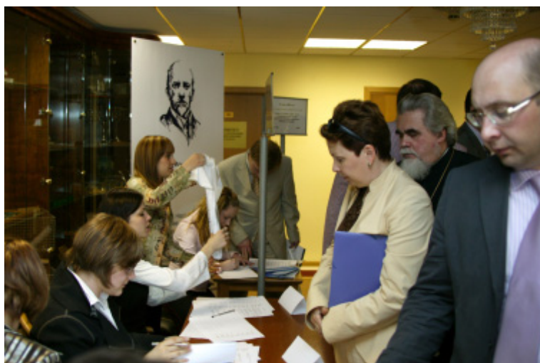
В кулуарах конференции