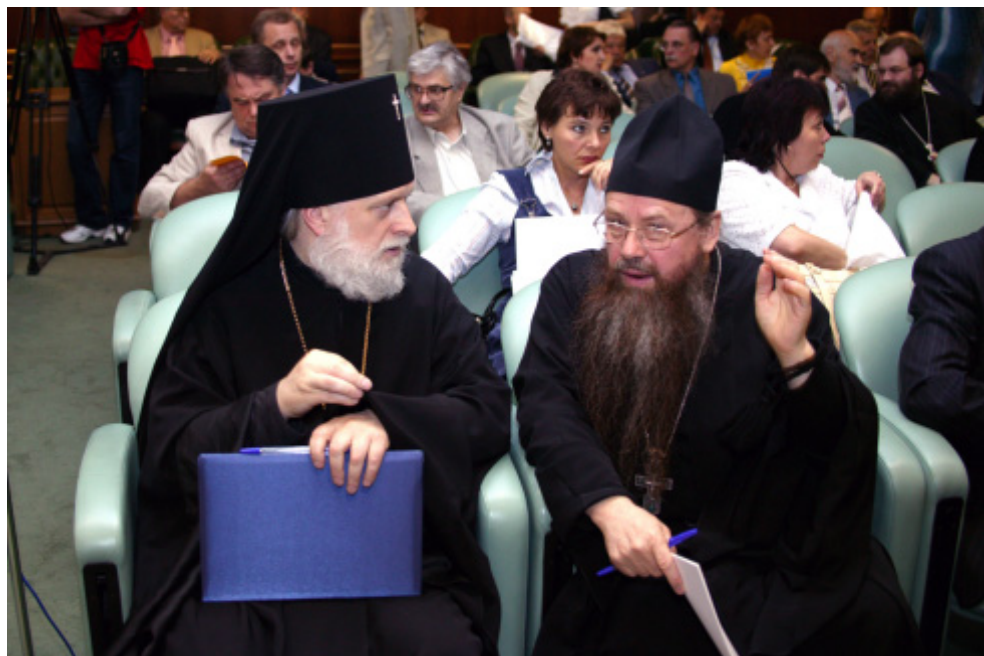
Архиепископ Верейский Евгений, архимандрит Алексей (Поликарпов)