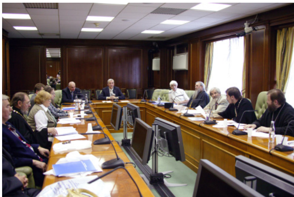
Заседание "круглого стола"