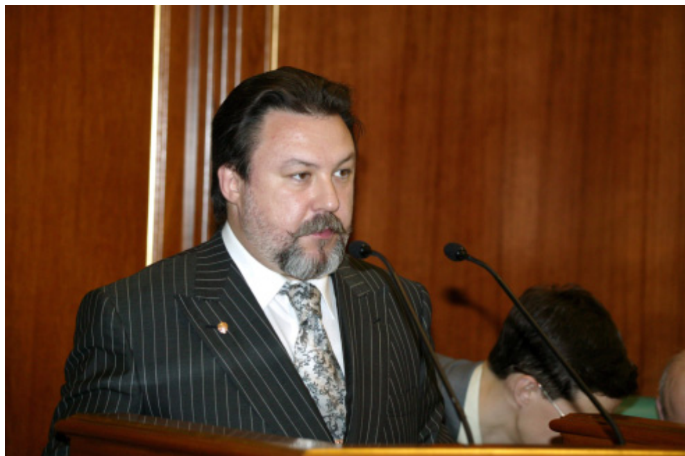
Ю.К. Лагтев, советник Президента Российской Федерации