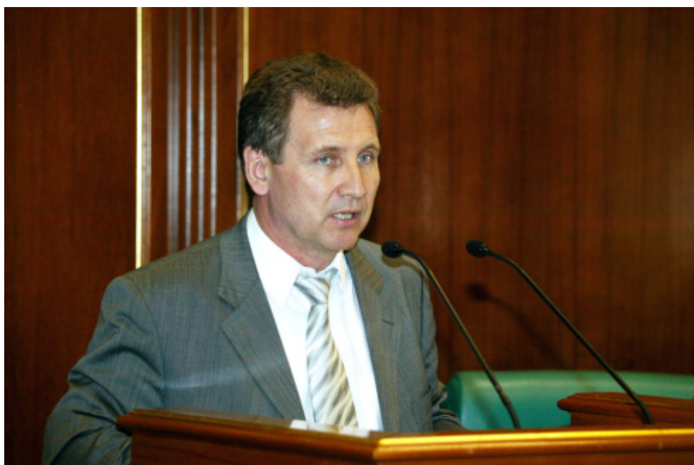
Г.П. Ивлиев, председатель Комитета Государственной Думы по культуре