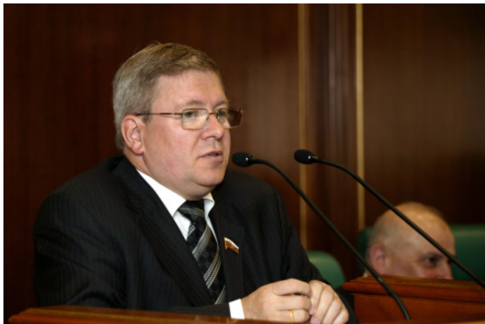
А.П. Торшин, первый заместитель Председателя Совета Федерации