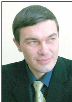
Ренат Накифович ВАЛИУЛЛИН, первый заместитель председателя Исполкома Всемирного конгресса татар