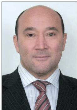
Марат Гочиевич АХМЕТОВ, заместитель Премьер-министра Республики Татарстан – министр сельского хозяйства и продовольствия Республики Татарстан