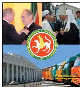
На первой странице обложки: Субъект Федерации – Республика Татарстан