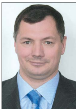
Марат Шакирзянович ХУШНУЛЛИН, министр строительства, архитектуры и жилищно-коммунального хозяйства Республики Татарстан