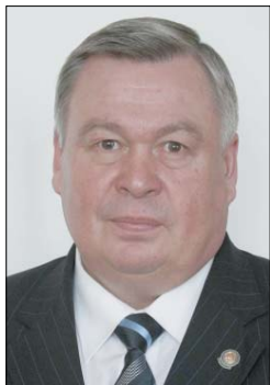
Камиль Шагарович ЗЫЯДИНОВ, министр здравоохранения Республики Татарстан