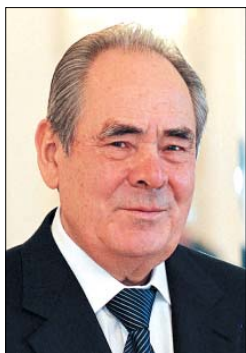
Минтимер Шарипович ШАЙМИЕВ, Президент Республики Татарстан