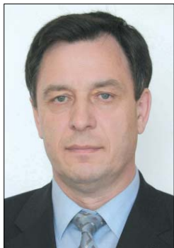
Раис Фахихович ШАЙХЕЛИСЛАМОВ, министр образования и науки Республики Татарстан