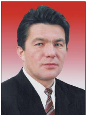
Виктор Алексеевич ОЗЕРОВ, председатель Комитета Совета Федерации по обороне и безопасности