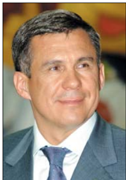
Рустам Нургалиевич МИННИХАНОВ, Премьер-министр Республики Татарстан